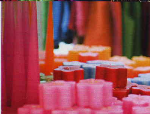
Candele e abiti nel negozio Kenkävero (a fronte, in basso), a Mikkeli, edificio storico con ampio giardino e ristorante. Sopra, filati di lino prodotti da Raijan Aitta. A fronte, il Saimaa in prossimità del Blue White Resort Sahanlahti.

La foca si nasconde. Beffando la curiosità dei turisti e le attese dei bimbi, il buffo musetto di questa specie protetta continua a contendere agli umani i guizzanti muikku , a giocare fra le alghe di seta e piroettare gioiosa nelle profondità opache e dense del la-