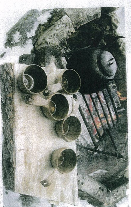
Helf und Schnee: Und wenn es auf dem See zu kalt wird, der wirt mit sich im Wirtel, am Feuer oder in einem Zimmer der Jannoboot-Design-Villen.