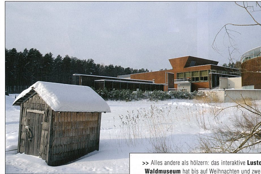
>> Alles andere als hölzern: das interaktive Lusto-Waldmuseum hat bis auf Weihnachten und zwei Wochen im Januar ganzjährig geöffnet >> Erst die Arbeit, dann das Vergnügen. Nach der Schlittschuhtour schmeckt die Pause noch mal so gut

über den verschneiten See schlappen. Hat man sich erst einmal an die neue Gangart gewöhnt, kann man den Blick auch wieder heben und die Weite der finnischen Natur genießen. Gerade als wir uns warm gelaufen und den richtigen Takt gefunden haben, treffen wir auf zwei eiskalte Burschen – im wahrsten Sinne des Wortes: Zwei Eisfischer haben ihr Auto direkt neben einem Eisloch geparkt, um nach ihren Netzen vom Vortag zu schauen. Ziemlich unverfroren taucht einer von ihnen mit bloßen Händen ins eisige Wasser und holt die Beute heraus. Hecht und Barsch wird es wohl zum Abendbrot geben. Dass er die ohne Handschuhe aus dem Wasser zieht, macht augenscheinlich den richtigen Finnen aus. Als wäre nichts gewesen, zerteilt er anschließend – erstaunlich feinmotorisch – seine Beute. Unsere Hände werden schon vom bloßen Zusehen kalt, so dass wir uns schleunigst wieder auf den Weg machen; wohl wissend, dass auf uns eine heiße Sauna wartet. Denn wir befinden uns ja in dem Saunaland schlechthin. Und